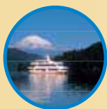
蘆之湖遊覽船 (雙體客船)