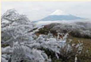
1월 후지산과 상고대