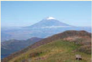
12월 쾌청한 후지산