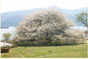
4월 오시마 벚꽃(하코네엔)