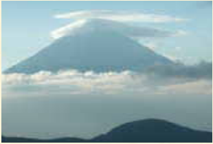
9월 우산을 쓴 후지산