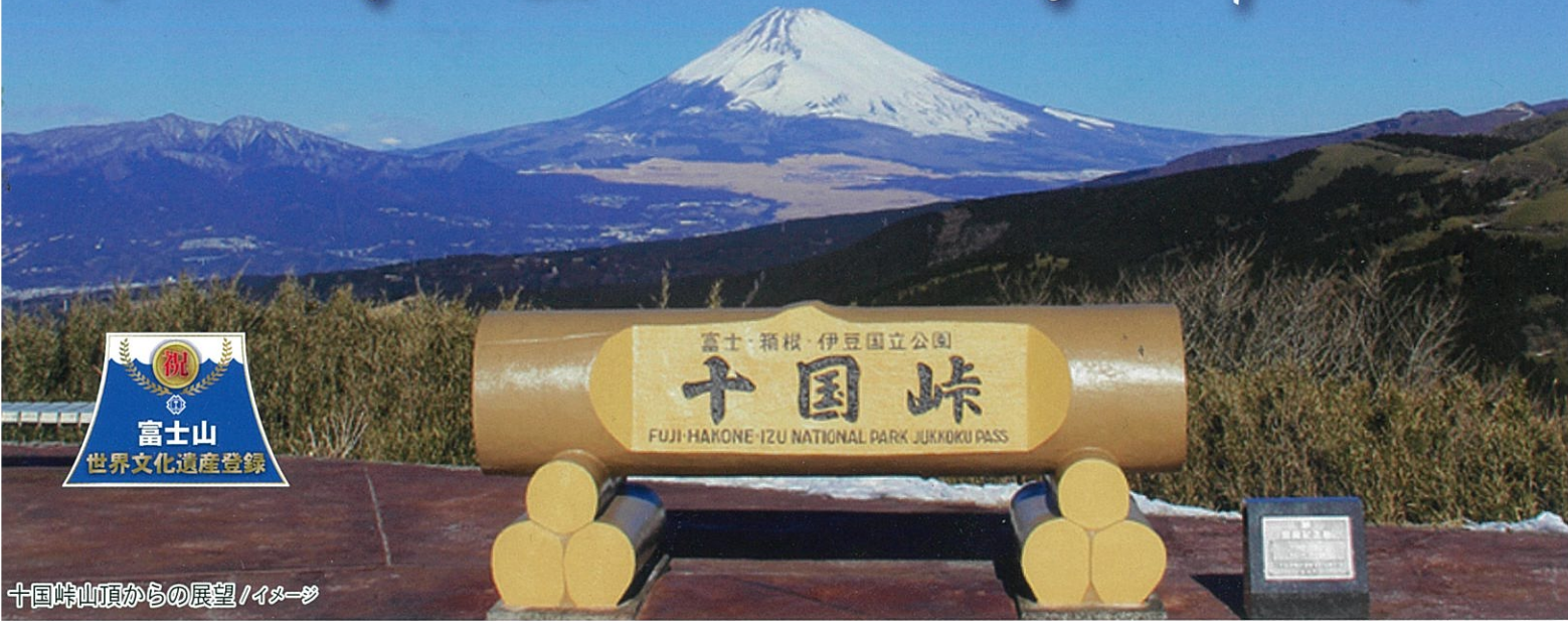
十国峠山頂からの展望 / イメージ