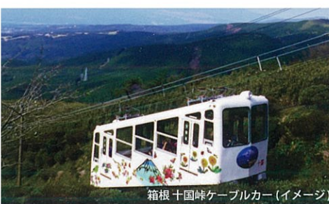
箱根 十国峠ケーブルカー (イメージ)

＜ご利用案内＞◆本券は、十国峠ケーブルカー(1往復)乗車付 熱海駅～十国峠登り口間の区間内路線バス1日フリー乗車券です。◆本券は、伊豆箱根バス熱海営業所またはフリー区間内バス車内にてお求めいただけます。◆本券は、発売日当日に限り、指定区間内の伊豆箱根バスに何回でも乗り降りできます。◆十国峠からの熱海方面行ききのバスは、梅園入口停留所には立寄りません。◆本券の払い戻しはいたしません。ただし、点検・荒天等の理由により、十国峠ケーブルカーが有効期間中に全便運休となった場合に限り、差額分を払い戻しいたします。◆十国峠ケーブルカーご乗車の際は係員に、バスをご利用の際は降車時に乗務員に本券をご呈示ください。◆十国峠ケーブルカーが点検等で運休の場合は販売を中止します。