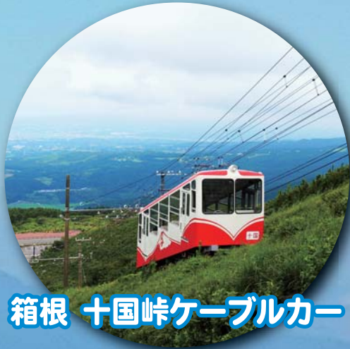
箱根 十国峠ケーブルカー