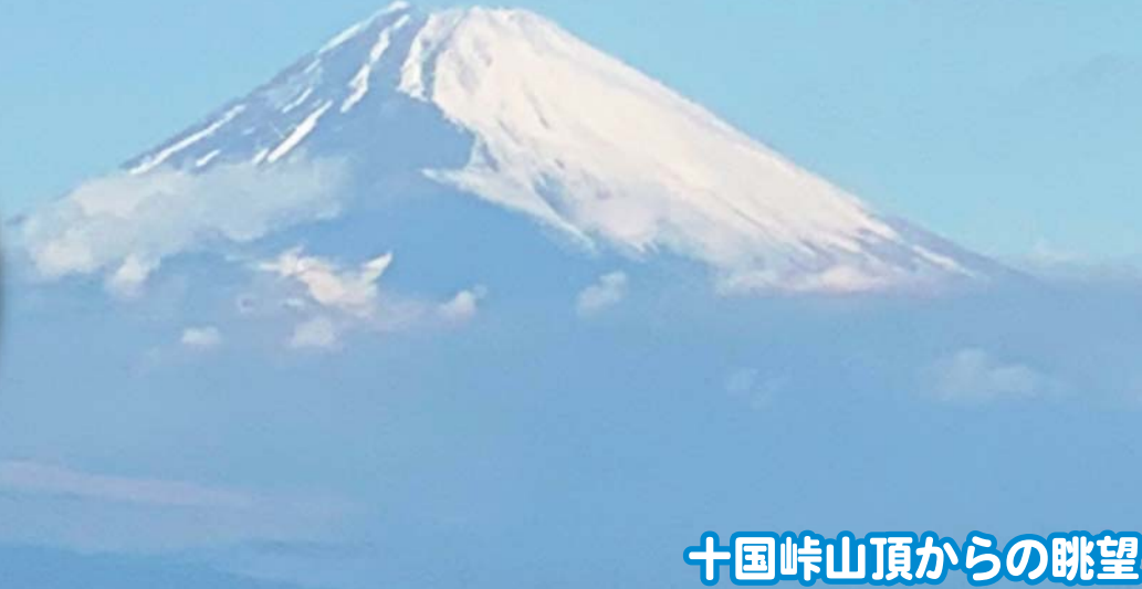
十国峠山頂からの眺望