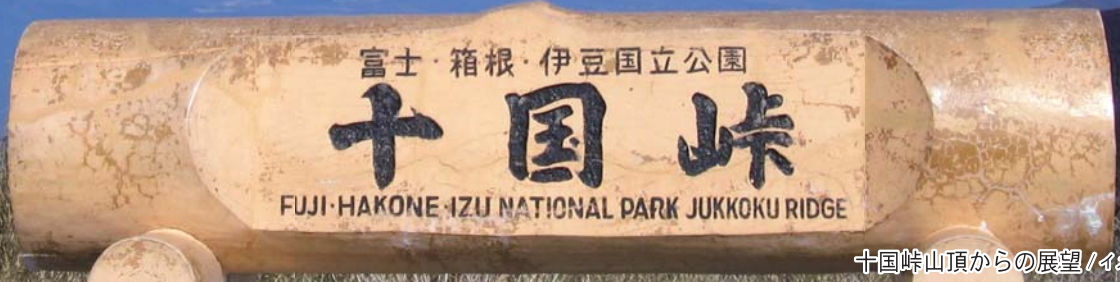
十国峠山頂からの展望 / イメージ