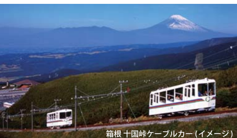
箱根 十国峠ケーブルカー(イメージ)

＜ご利用案内＞◆本券は、十国峠ケーブルカー(1往復)乗車付 熱海駅～十国峠登り口間の区間内路線バス1日フリー乗車券です。◆本券は、伊豆箱根バス熱海営業所またはフリー区間内バス車内にてお求めいただけます。◆本券は、発売日当日に限り、指定区間内の伊豆箱根バスに何回でも乗り降りできます。◆十国峠からの熱海方面駅行きのバスは、梅園入口停留所には立寄りません。◆本券の払い戻しはいたしません。ただし、点検・荒天等の理由により、十国峠ケーブルカーが有効期間中に全便運休となった場合に限り、差額分を払い戻しいたします。◆十国峠ケーブルカーご乗車の際は係員に、バスをご利用の際は降車時に乗務員に本券をご呈示ください。◆十国峠ケーブルカーが点検等で運休の場合は販売を中止します。