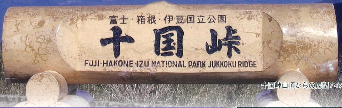
十国峠山頂からの展望/イメージ