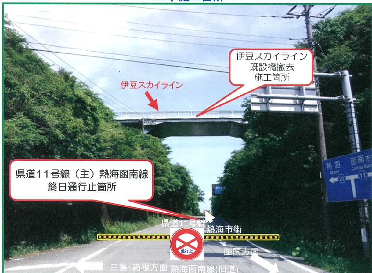
県道11号線(主)熱海函南線の田方郡函南町熱海峠交差点より撮影