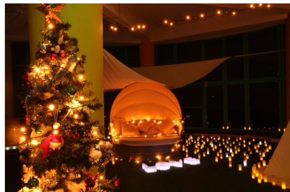
ノスタルジックナイトイメージ