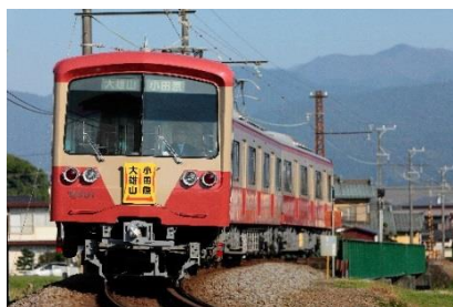
伊豆箱根鉄道で運行中の「赤電」