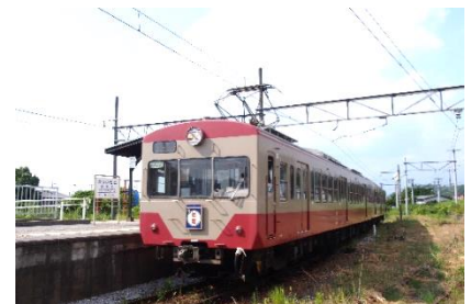
近江鉄道で運行中の「赤電」