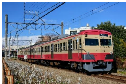
西武鉄道で運行中の「赤電」

さらに、10月3日(水)からは、西武鉄道、伊豆箱根鉄道、近江鉄道の指定駅で一般発売します。 詳細は、別紙のとおりです。