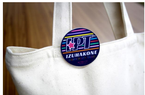
オリジナルアクリルバッジ