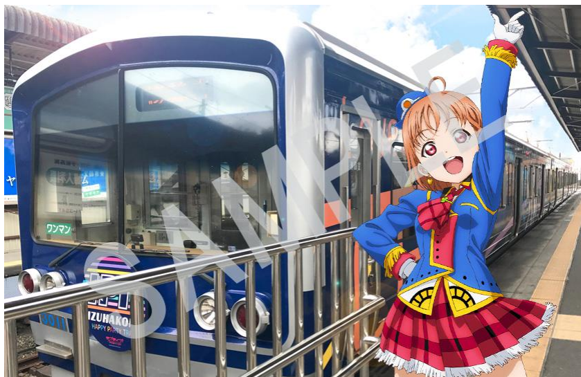
フォトコンテスト応募例