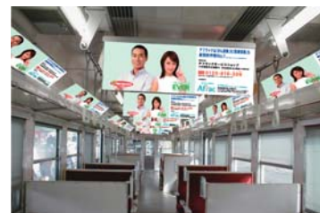
伊豆箱根鉄道電車広告等級表