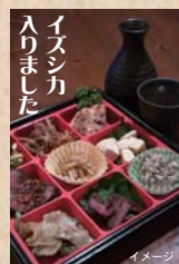
イズシカ 入りました

※お食事は上記の追加料理を予定。他、別料金にて。追加する場合は変更する場合がございます。