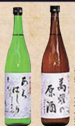
清酒「萬燿原酒」 清酒「あらはしり」