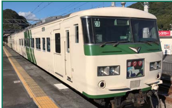
JR東日本185系 11・12号車自由席、13～15号車指定席