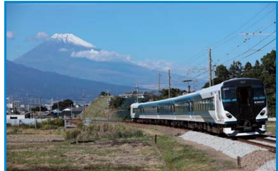
JR東日本E257系 全席指定席(10～14号車)