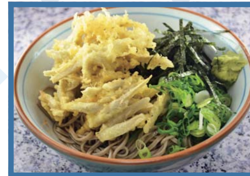
冷やしごぼ天そば 510円

冷やし椎茸そば 510円 冷やしかいわれそば 560円 • メガざるそば(そば3玉) 750円 • ざるそば 410円