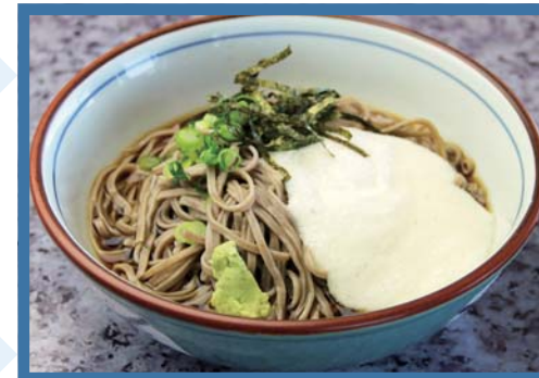
冷やしとろろそば 610円