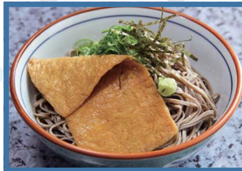
冷やしきつねそば 460円