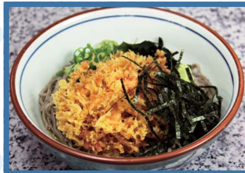
冷やし桜えび天そば 710円