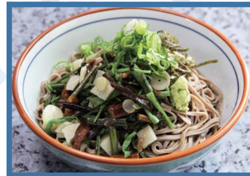
冷やし山菜そば 460円