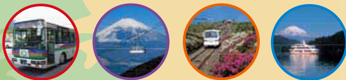
이즈하코네 버스 고마가타케 로프웨이 줏코쿠토게 케이블카 아시노코 유람선(쌍둥선)