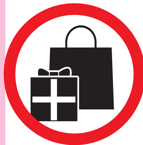
Souvenirs etc. お土産等