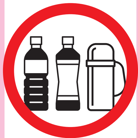
Plastic bottles, water bottles ペットボトル、水筒類

Please refrain from bringing any drinks onto the bus other than those with lids (bottles, glass bottles with lids, water bottles, etc.).