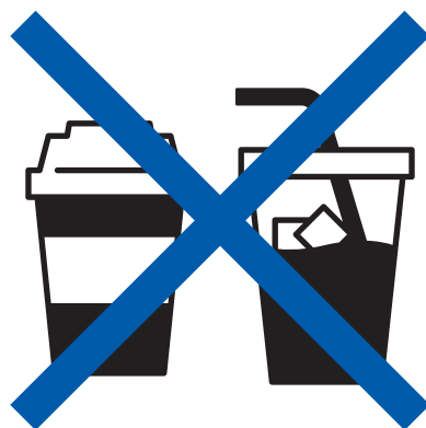
Drinks with lids purchased at convenience stores, etc. コンビニ等で購入した 蓋つきの飲み物 (ご遠慮願います)