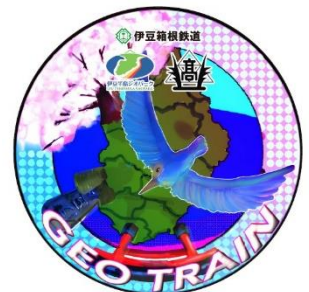
ヘッドマークイメージ