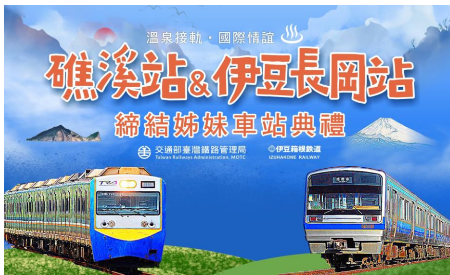
車両のヘッドマークデザイン

当社ではこの姉妹駅協定締結を記念し、11月19日（木）に下記のとおり、姉妹駅協定締結記念ヘッドマークおよび車内中吊りジャック車両の出発式を実施いたします。