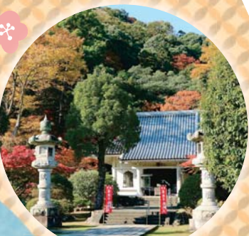
願成就院 (伊豆の国市)