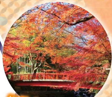
修善寺 桂橋 (伊豆市)