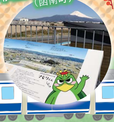
道の駅 「伊豆ゲートウェイ函南」 (函南町)