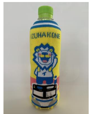
「1300系ペットボトルカバー」 イメージ